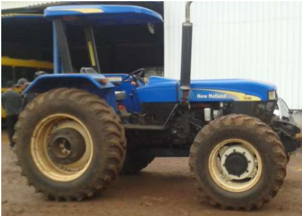
Vista parcial do trator agrícola